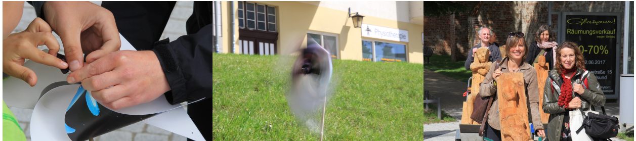
Spurwechsel-Station Knieperwall: Bau eines Windrades • Es dreht sich! • Ankunft der „Wartenden“

Die Umweltkisten können bei uns ausgeliehen werden – sowie in einer langsam aber stetig wachsenden Zahl von Verleihstellen. Übersichtskarte: www.umweltschulen.de/bibo/umweltkisten.html